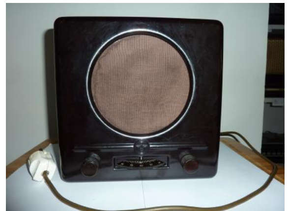
Die „Goebbelschnauze“ der einfache Volksempfänger

Sonntag, 21. 9. 2014 um 15 Uhr im Radiomuseum Wertingen, Fère-Straße 2, Jeden dritten Sonntag des Monats von 14 bis 17 Uhr geöffnet - ca. 400 Grammolas, Grammophone, Radiodetektoren, Röhrenradios, Musik-Fernsehtruhen, Tonbänder, 3 Musikboxen, und und und Eintritt frei – Spenden erbeten